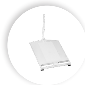
R-GO MORELIA DOCUMENTENHALTER