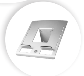
R-GO MORELIA LAPTOP-HALTERUNG